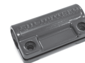
5 Klemmschelle Clamp