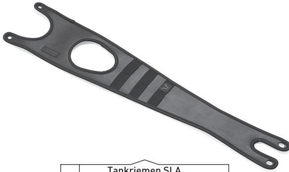
1 1x Tankriemen SLA Tank Strap SLA BC_TRS,06.642.900,01