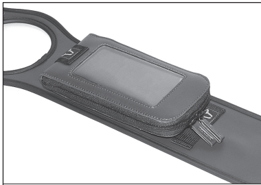
Features: Anbringungsmöglichkeit von zusätzlichem Gepäck. Features: Attaching possibility for additional luggage.